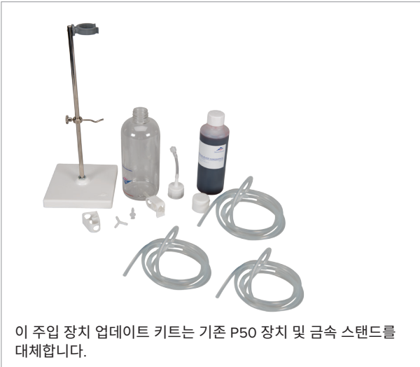
기존 주입 장치